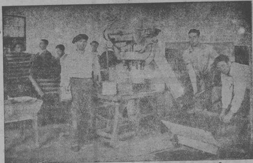
Vista de la sección de mosaico

Las especialidades de esta Fábrica, se basan en la fabricación de: Teja plana y curva, mosaicos, tuberías, etc., por disfruta de excelentes y seleccionadas arenas, mezcla mecánica y riego por cámara pulverizadora.