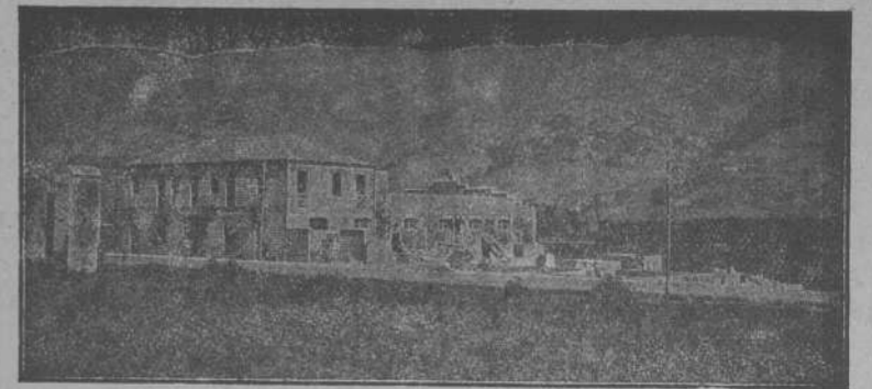
Vista de la Fábrica a la carretera de Ponferrada a Orense

Inmejorable teja plana y curva patentada. - Cumbreas y Remates. - Escrupulosidad en la fabricación de mosaicos lisos y en colores, comprimidos a 200 atmósferas de presión, con prensas hidráulicas y eléctricas. - Bloques para muros. - Ladrillo de escoria Variedad en ménsulas, jarrones y balastradas etc. - Fregaderas piletas, peldaños y toda clase de trabajos relacionados a mármoles comprimidos. - Tuberías con enchufe, para conducción de aguas con y sin presión. - Altas calidades y precios económicos.