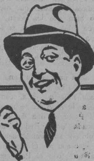
FOTO VILLAR Frente a Correos VILLAR FOTO

Cuide usted su estómago porque es la base de su salud