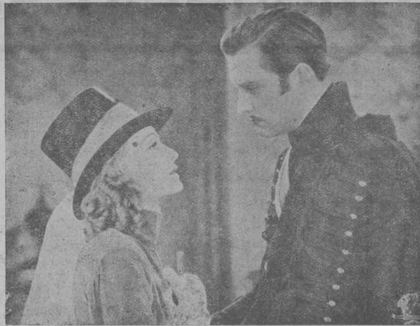
La deliciosa Lilian Harvey en su reciente producción de Cifesa «La bailarina del conjunto».

La deliciosa Lilian Harvey en su reciente producción de Cifesa La bailarina del Conjunto