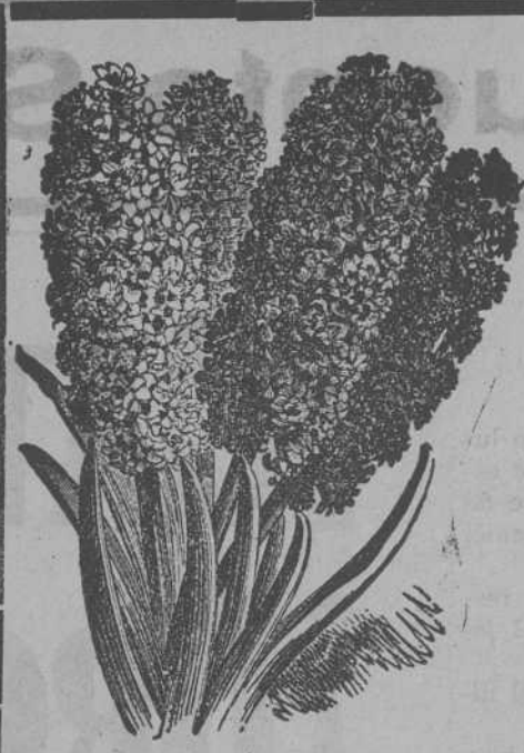
Jacintos dobles de Holanda

JOSÉ BLANCO VEGA :- Plaza del Hierro, núm. 1 (soportales)