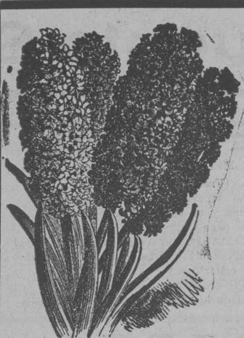
Jacintos dobles de Holanda

Se vende madera de todas clases, en tablas tablones y tabla machihembra.