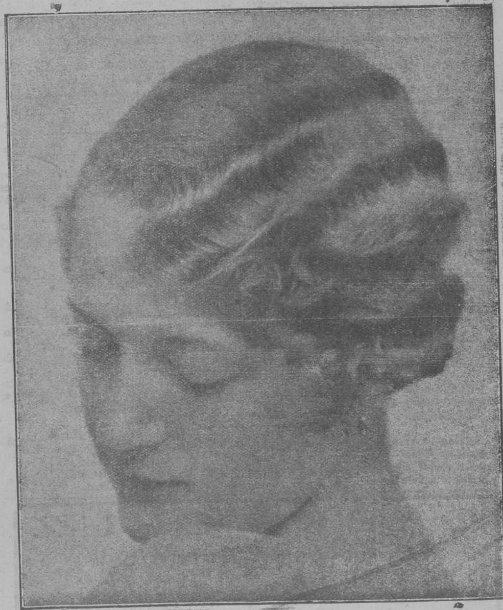
Las ondulaciones permanentes AMADOR se distinguen de las demás en elegancia y duración. Teléfono 253, ORENSE

Para la curación radical de los sa- bañotes.