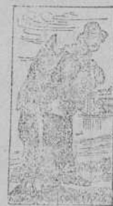
Marca de fábrica.

Deben tomar una medicina alimento que les permita recobrar con rapidéz las carnes, las fuerzas y la salud perdidas. Esta medicina-alimento es la famosa