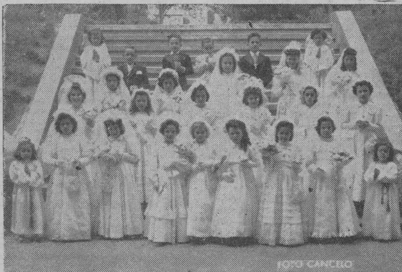
El pasado día 15, festividad de la Ascensión del Señor se ha celebrado, siguiendo la tradicional costumbre, numerosas Primeras Comuniones que han puesto en los templos y en la calle una nota de sabor religioso. La presente fotografía recoge un grupo de niños y niñas que recibieron por primera vez el Pan de los Angeles en la capilla de las MM. Josefinas, de La Coruña.