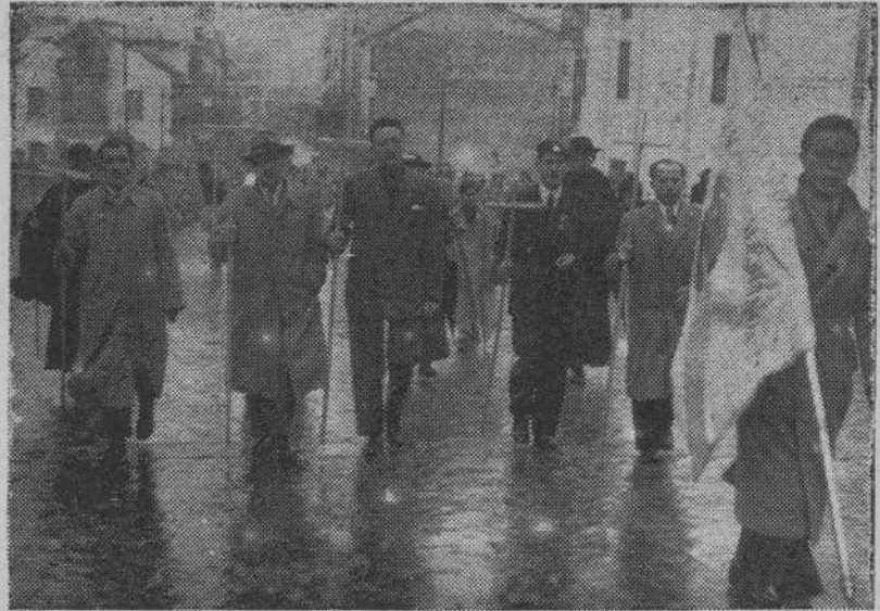
Presidencia de la peregrinación de la juventud coruñesa al Santuario de la Virgen de Pastoriza

Terminado el acto eucarístico, y en el atrio de la Iglesia, se dió fin a la peregrinación con un acto público de Acción Católica, en el que tomaron