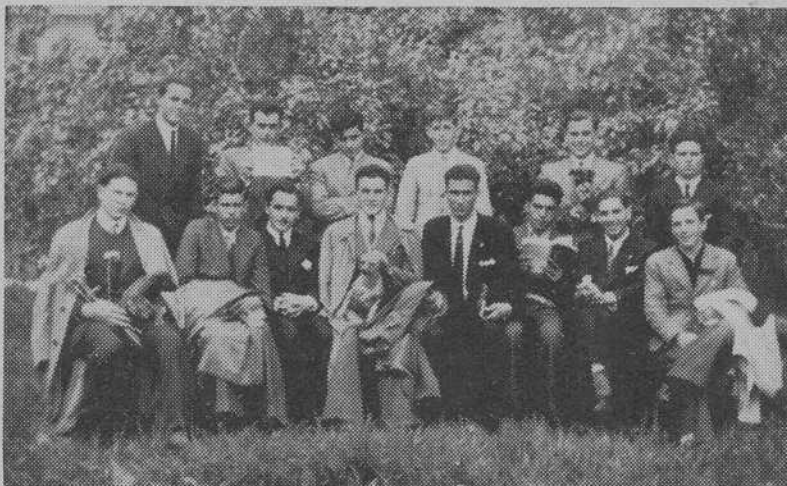
También los jóvenes, de Villanueva de Arosa, que figuran en esta fotografía, practicaron Ejercicios cerrados en Caldas de Reyes