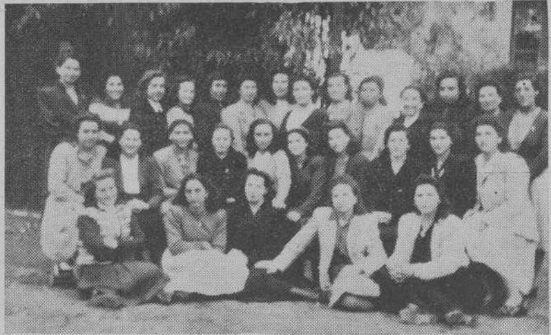
Grupo de jóvenes de Villanueva de Arosa, que practicaron Ejercicios en Caldas de Reyes