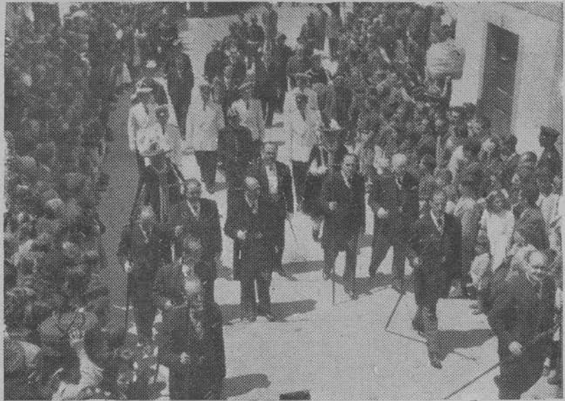
La peregrinación del Asciprestazgo de Faro, destacó por el número de fieles que la integraron. He aquí la Corporación municipal coruñesa que ocupaba una de las presidencias

4.º En los puntos de veraneo donde no esté organizada Acción Católica se procurará formar un Centro de verano. Las veces de la Delegada las hará una chica del pueblo que esté formada para ello (que el Consejo señalará) ayudada por algunas más, o si esto no fuera