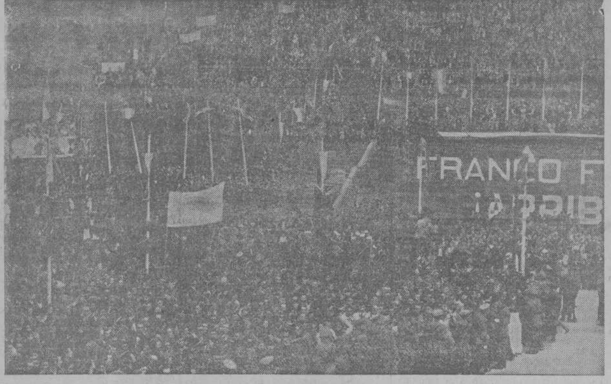
El pueblo de Mieres, congregado en la plaza y en el monte, aclamó fervorosamente al Jefe del Estado en su reciente visita a dicha villa asturiana.