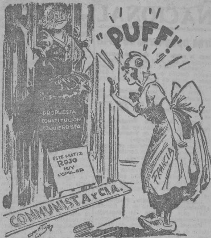
LA ULTIMA MODA DE PARIS