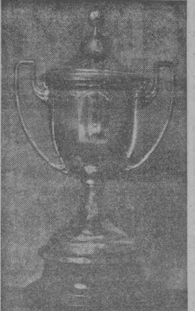
Reproducción de la Copa Galicia, trofeo que se disputará en las tiradas oficiales de Plohón los días 6 y 7 de septiembre, en el Campo de Santa Isabel, de Santiago de Compostela.

A su paso por la capital de España, Borbolla, José Luis Borbolla ha comenzado ya a hablar; y después de haber traído dos banderines para el fútbol y el Deportivo, como obsequio de la Federación Nacional de Méjico, declaró: "Vengo a completar una misión que dejé pendiente, y hoy confío en triunfar".