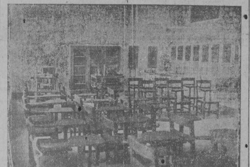
Una de las nuevas aulas para clases teóricas, que comenzarán a funcionar en el próximo curso.

te cantidad para la instalación de estos laboratorios.