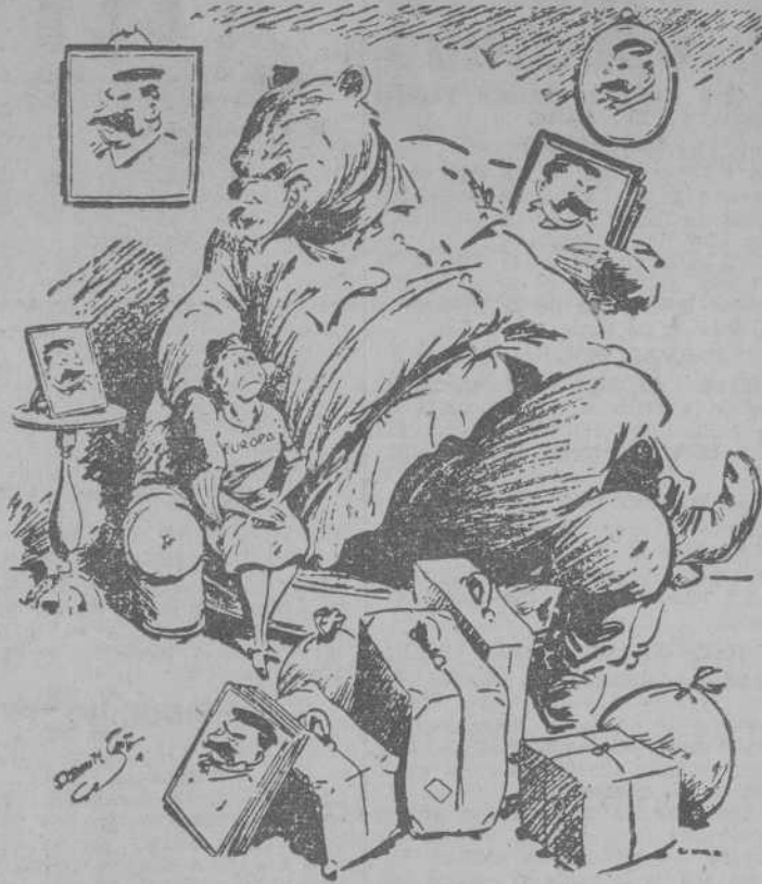
—Tiene usted un buen asiento ahí ¿le importa que me siente a su lado?

NOTA: Se advierte a todos los usuarios de Tarjetas de Aprobamiento clase "E" (Turismos de alquiler y Médicos) que deben ir provistos de la Tarjeta de Aprobamiento, a fin de justificar ante la Policía de Tráfico y Aparatos Surtidores, el derecho a la exención del Impuesto de Restricción.