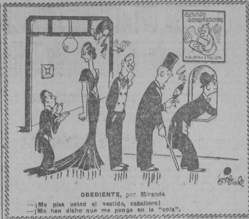
OBEDIENTE, por Miranda —¡Me pisa usted el vestido, caballero! —¡Me han dicho que me ponga en la "cola".

DOLORES GOLPES CONTUSIONES REUMA EMBROCACION HERCULES VERDADERO UNIMENTO ESPAÑOL ALIVIA TODO DOLOR