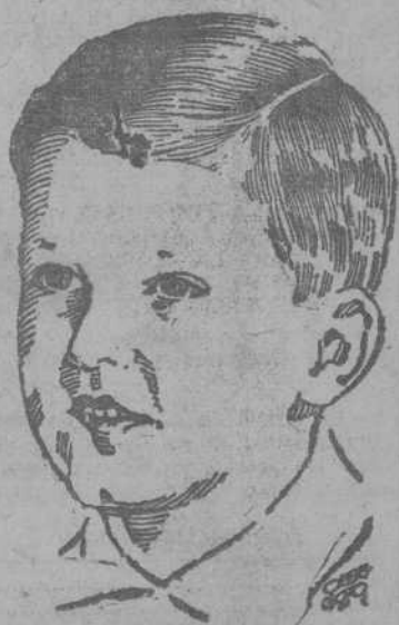
SIMEON II DE BULGARIA

Se da por descontado la abolición del régimen monárquico