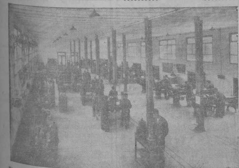
El taller de mecánica, amplio, limpio y claro, como todas las dependencias de la Escuela.