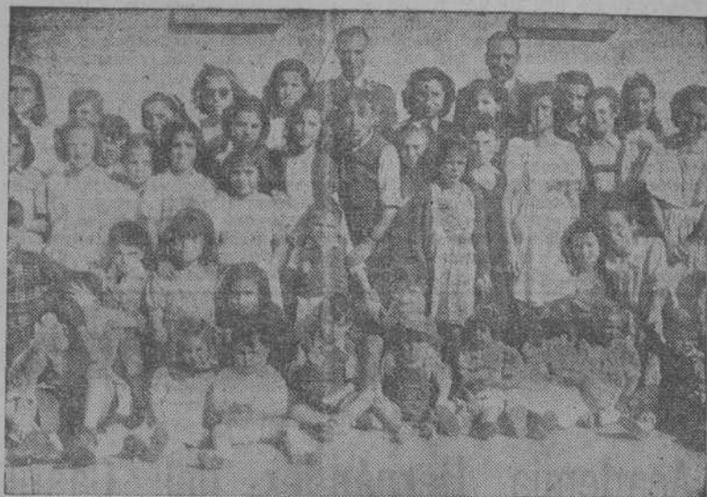
Grupo de hijos de reclusos en la Prisión Provincial de La Coruña, que participaron en los diversos actos celebrados con motivo de la fiesta de Nuestra Señora de la Merced

Con motivo de la festividad de la Excelsa Patrona de Prisiones, Nuestra Señora la Virgen de la Merced, se celebraron ayer en la prisión provincial de La Coruña diversos festejos.