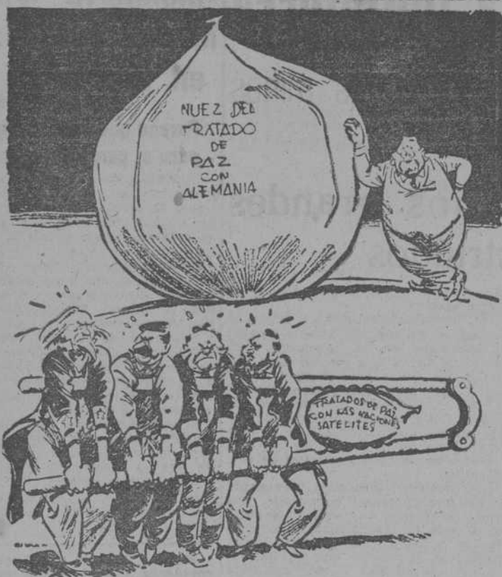
¡TODAVIA NO HAN VISTO NADA!