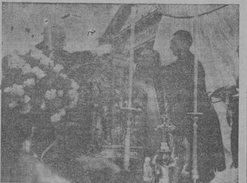
Momento de serle impuesta la corona a la Virgen por el Cardenal Arce Ochotorena y el Presidente de la Diputación Foral, Conde de Rodezno.