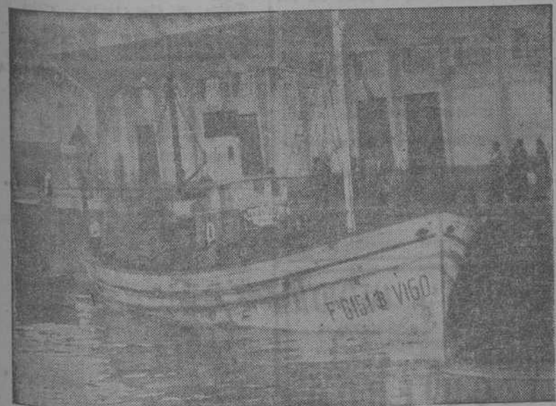
El vapor pesquero "Mary-Zoila", al que se daba por desaparecido en el Gran Sol, atracado en el muelle de la Palloza

Molotov ha dicho que le será imposible permanecer en París después del 15 de octubre, pues tiene que ir a Moscú antes de tomar el avión para los Estados Unidos.—(EFE).