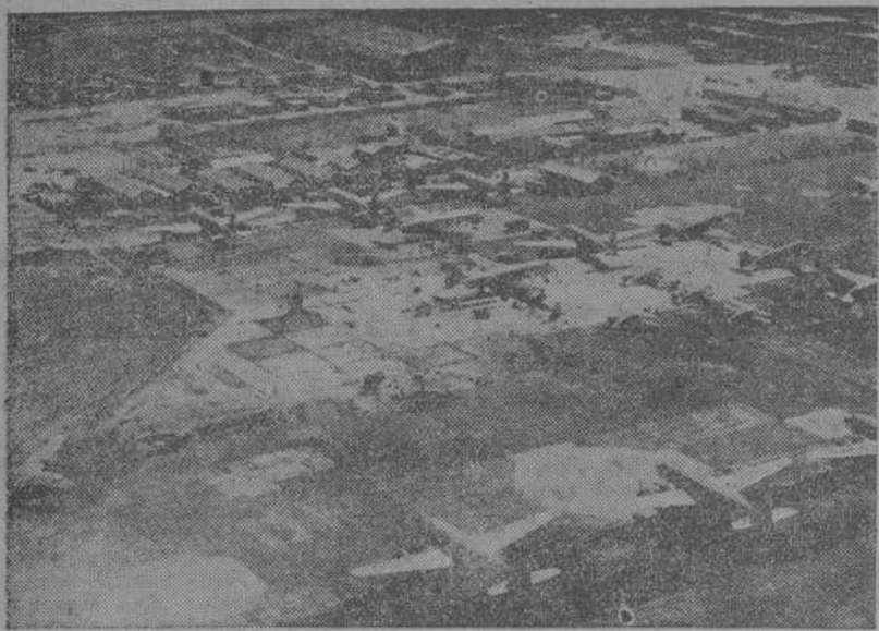
Vista panorámica del aeropuerto de Schiphol (Amsterdam), en periodo de reconstrucción