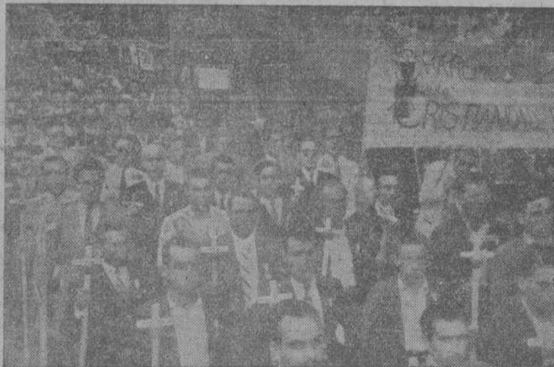
CARTAGENA.—La peregrinación de la Juventud Masculina de Acción Católica a su paso por las calles de Cartagena, camino de Santiago de Santa Lucía, lugar donde por primera vez pisó tierra española el Apóstol Santiago.