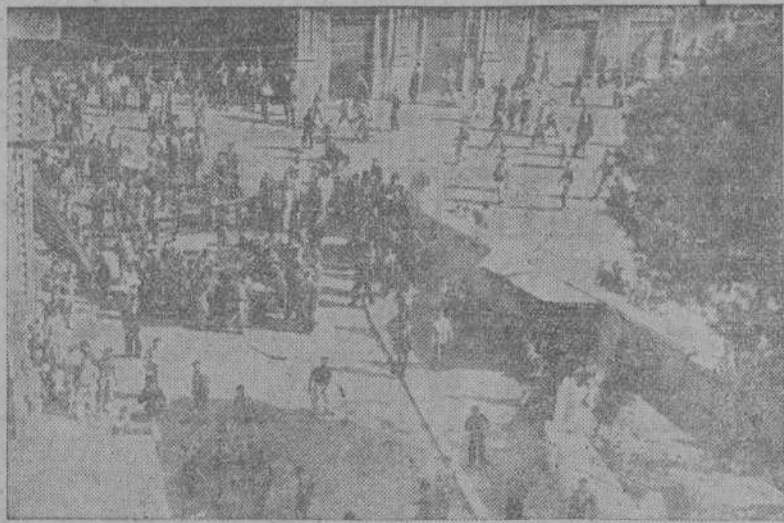
Más de 30.000 parados intentaron invadir el Ministerio del Interior, donde fueron rechazados por la fuerza pública. En el choque hubo muertos y varios centenares de heridos.

Si cada uno cumplierse con su obligación, como es debido, presto tornarían las misiones a reverdecer llenas de vida. (Benedicto XV).