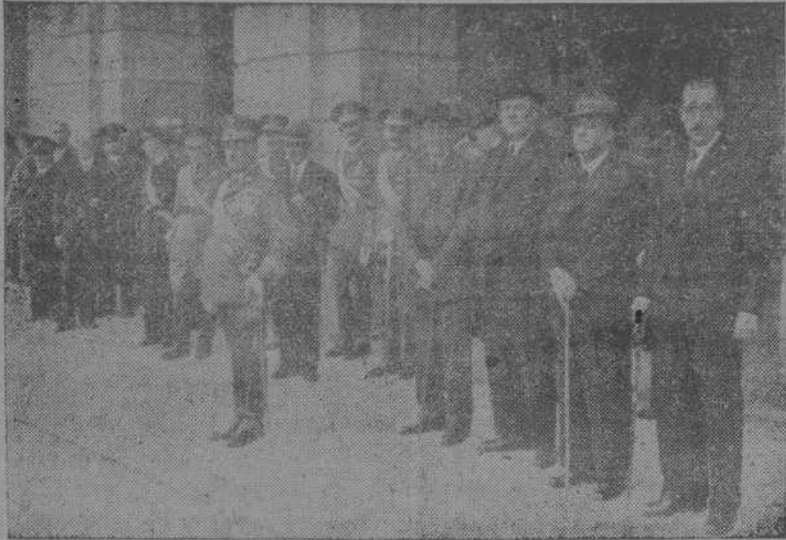
El Capitán General con las autoridades locales y representaciones, presenciando el desfile de las tropas de Intendencia, después de la misa efectuada en la parroquia de San Jorge

Misolemne y diversos festejos en el cuarte