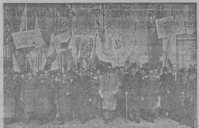
Las autoridades sevillanas, entre las que se encuentra el general Queipo de Llano, encabezan la manifestación celebrada en Sevilla contra la ingerencia extranjera en los asuntos de España. (Foto CIFRA).