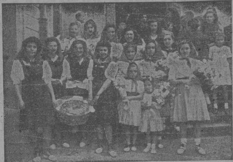
Camaradas de la Hermandad de la Ciudad y el Campo que ofrendaron frutos y flores a San Isidro Labrador, en la parroquia de San Pedro de Mezo.

Ayer se celebró con gran solemnidad la fiesta del Patrón de los agricultores, San Isidro Labrador. A los actos que tuvieron como marco nuestra ciudad, asistieron los funcionarios y personal de todos los centros agrícolas, pecuarios y forestales de la provincia. Organizada por la Cámara Oficial Agrícola, Unión Territorial de Cooperativas