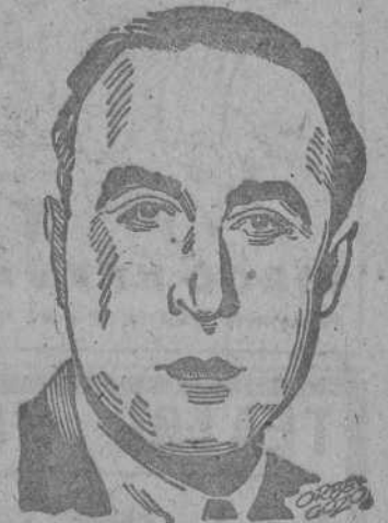
JOSE MARIA DE ARELIZA

BUENOS AIRES, 15.—A bordo del "Caño de Buena Esperanza" ha llegado a esta capital el nuevo embajador de España, don José María Areliza, a quien acompaña su familia.