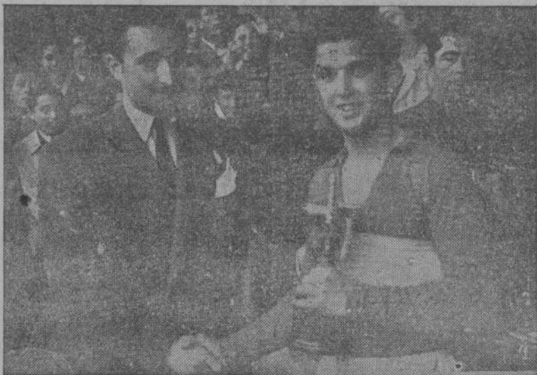
El Delegado Provincial del Frente de Juventudes hizo entrega de los trofeos a los vencedores en las pruebas atléticas celebradas ayer en Estadio de Riazor

EL PASO (TEJAS), 30.— Los habitantes de esta ciudad fueron despertados anoche por una violenta explosión, que se cree fué provocada por el lanzamiento de un proyectil del tipo de las V-2, desde White Sands. El encargado de las bases de lanzamiento de White Sands ha confirmado que un proyectil de este tipo fué lanzado ayer y que a causa de la explosión, numerosas personas fueron arrojadas contra el suelo en la ciudad de Juárez, próxima a la frontera de los Estados Unidos y Méjico.—(EFE)