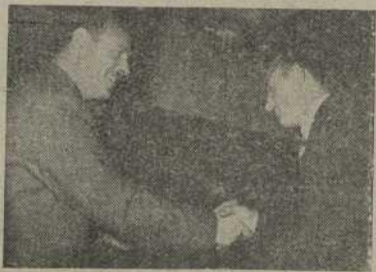
Concurso Destreza en el Oficio. Especialidad torne, os.