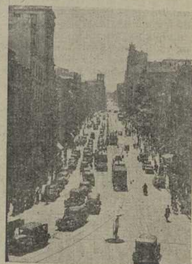
La impresionante caravana automovilista a su paso por las calles de la ciudad

Poco después de las nueve y media se puso en marcha la caravana, en el siguiente orden: abría la marcha un coche con altavoces, a través de los cuales se daban las órdenes necesarias y se interpretaba música adecuada; seguían una pareja de Policía Urbana motorizada; a continuación la imagen de San Cristóbal, en artística carroza, que iba escoltada por una sección de la Policía Urbana motorizada, y seguidamente un verdadero enjambre de motos de todas marcas y potencias, taxis y turismos en formación de tres en fondo, y camiones, y cerraban la caravana ómnibus y coches de servicio auxiliares. El paso de la imponente ca-