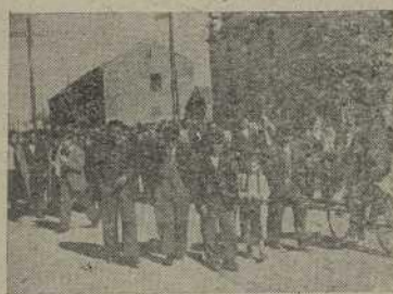
Una gran masa de agricultores asistió a un acto de divulgación de Seguros Sociales y Subsidios celebrado en Silleda. Vemos aquí al numeroso público asistente, a la salida del cine en que tuvo lugar el acto.

Adiestramos y preparamos a 62 Corresponsales de la Obra que en todos los Municipios de la provincia desarrollando una labor de gigantes para dar a conocer a nuestros agricultores tan acostumbrados a recibir promesas sin que a la hora de la verdad se convirtiesen en realidades. Costó un trabajo impropio formalizar los primeros cientos de expedientes, pues los interesados, la mayor parte de las veces se negaban a firmar las solicitudes.