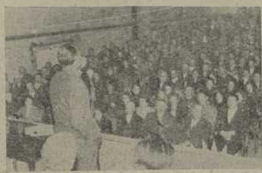
Aspecto que ofrecía el cine de La Estrada durante un acto de divulgación de Seguros Sociales organizado por la Jefatura de la Obra, en colaboración con la Vicesecretaría de Ordenación Social y la C. O. S. A.

Se había hecho con anterioridad un censo de los que pudieran estar afectos por esta disposición, que incluye a unos 10.000 labradores, pero la realidad superó con creces esta cifra, pues son centenares de ellos los que inicialmente atraídos por la labor de divulgación efectuada por la Obra a través de sus Corresponsales, acuden a formalizar sus expedientes solicitando dichos beneficios, y así vemos como al finalizar el año 1948, se ha-