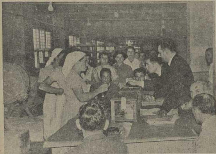
Votando en una de las secciones de la Empresa Manuel Alvarez e Hijos.

Tras esta primera fase de esta designación de Enlaces y con arreglo a lo que dispone el Calendario electoral, seguirá la elección de las Juntas Locales, a lo cual se preparan ya los electores, apuntando también como en la de Enlaces gran entusiasmo y afán de acierto.