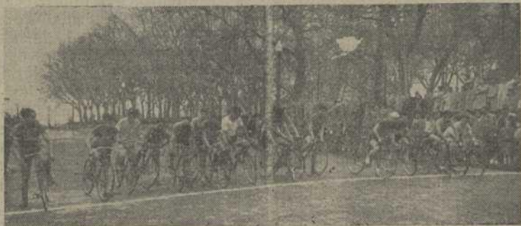
Participantes de la vuelta ciclista a Morrazo.

Cuando finalizados sus estudios comiencen sus actuaciones profesionales estos becarios, no olvidarán nunca y pregonarán con orgullo las facilidades que la Organización Sindical les ha dado para la obtención de su título superior.—F. T.