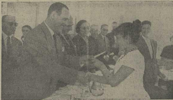
Clausura de un turno en la Residencia Luis Collazo de Panjón.