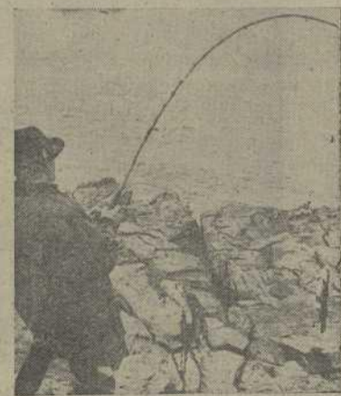
Uno de los participantes en el concurso de Pesca en su puesto.