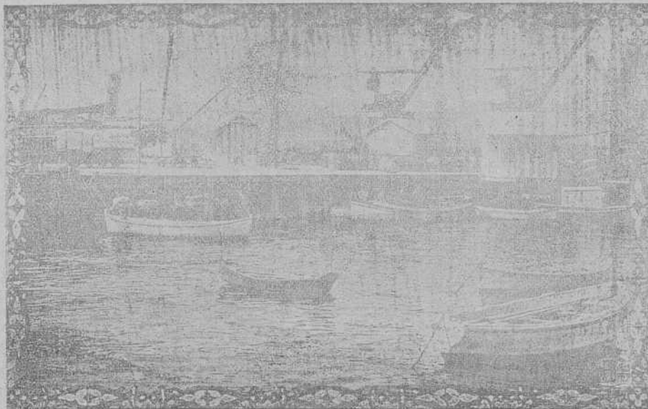
VIGO.-Muelles del Comercio.