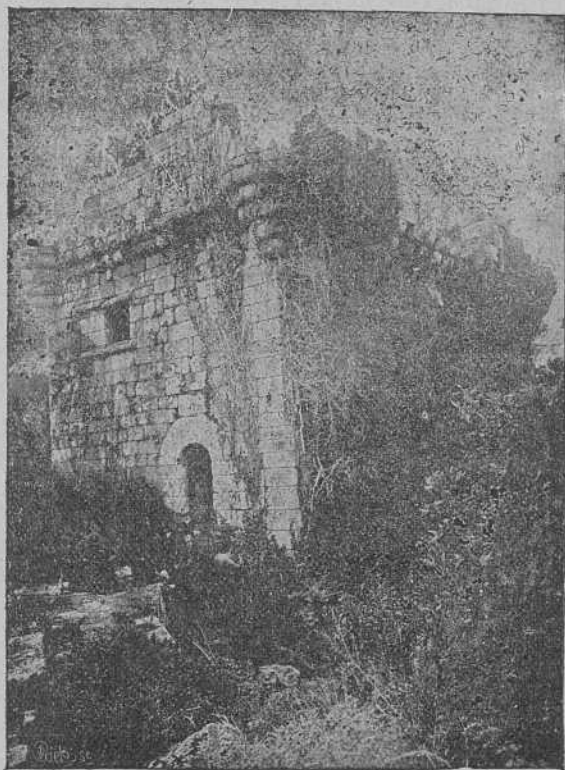
Ruina del secular castillo del Sobroso en Mondariz

Si hubiese camino hasta la falda de la empinada cumbre, donde como centinela de piedra se conserva este recuerdo de pasadas generaciones, apenas abriría persona en Galicia que dejase de visitarlo y solazarse ante la bella perspectiva que ofrecen los valles que desde aquel abrupto paraje se dominan.