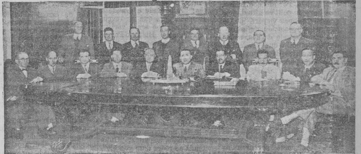
A honorable Xunta Directiva de Casa de Galicia, de Montevideo, que está orgaizando un gran homaxe ao Consello de Galiza, co gallo de complirse o nove aniversario do Estatuto de Galiza. Dado o fervoroso entusiasmo e as extraordinarias proporcións que se lle quere dar a estos actos, este aniversario alcanzará amplitude histórica.

De ambas comisións mandamos para A NOSA TERRA fotos a fin de que ilustren esta crónica.