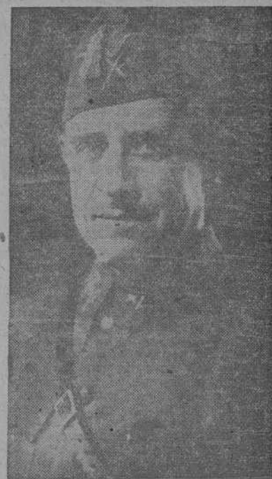
Excmo. Sr. D. Francisco Gómez Jordana, conde de Jordana, nuevo ministro de Asuntos Exteriores.