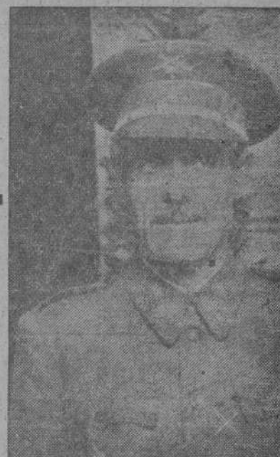
El nuevo Ministro del Ejército, general Asensio Cavanillas. Durante toda nuestra guerra de liberación se distinguió extraordinariamente por su valor, competencia y dotes de mando. Ha sido Alto Comisario de España en Marruecos, es consejero nacional de FET y de las JONS y actualmente desempeñaba la Jefatura del Estado Mayor Central.