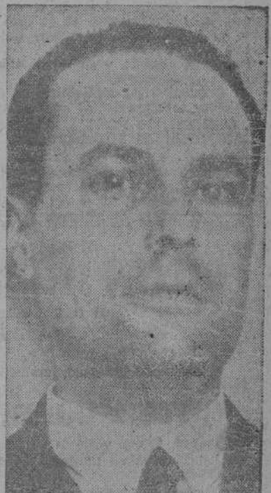
Excmo. Sr. D. Blas Pérez González, nuevo Ministro de la Gobernación.