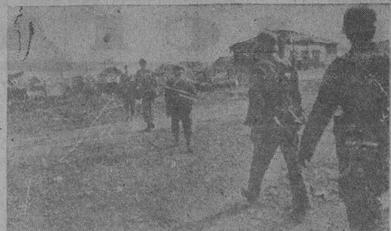
Casa por casa ha de ser conquistado Stalingrado por los soldados alemanes en esta dura lucha que será decisiva

Welles terminó afirmando que "una vez ganada la victoria, la influencia de los Estados Unidos se hará sentir con sus consejos en todo el mundo, así como será ofrecida nuestra colaboración para que la paz sea conservada".—(EFE).