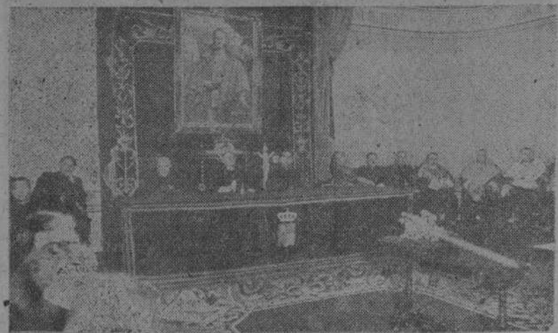
Presidencia de la solemne sesión de apertura de Curso en la Universidad compostelana.