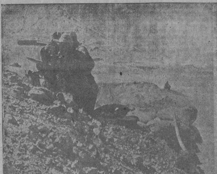
La posición alemana más al Sur del frente del Alamein. Una posición de observación en la región de Garé-El Himeimat.

EL CAIRO, 4.—Oficialmente se anuncia que ha resultado muerto en el campo de batalla el general alemán Von Summe, que era el jefe de más elevada categoría en las filas adversarias, después de Rommel, y el que le sustituyó mientras éste estuvo en Alemania.—(EFE)