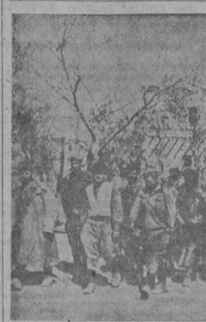
Triste aspecto para los rusos, éstos soldados soviéticos vuelven a desfilarse ahora por las calles de Stalingrado pero como prisioneros

AMSTERDAM, 4.— El Embajador norteamericano en Santiago de Chile ha visitado al Presidente Ríos para invitarle a visitar los Estados Unidos, según anuncia Radio Londres.—(EFE).