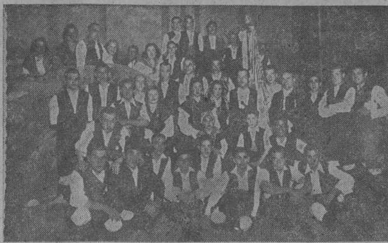
El Real Coro gallego "Toxos e Froles" de Ferrol

Con un teatro brillantísimo, adornado con reposteros, banderas del Movimiento, y con flores la embocadura del escenario, se celebraron ayer en el Rosalía Castro los dos interesantes conciertos a cargo del laureado coro ferrolano "Toxos e Froles"; con el patriótico objeto de recaudar fondos para la suscripción pro bandera del crucero "Galicia".