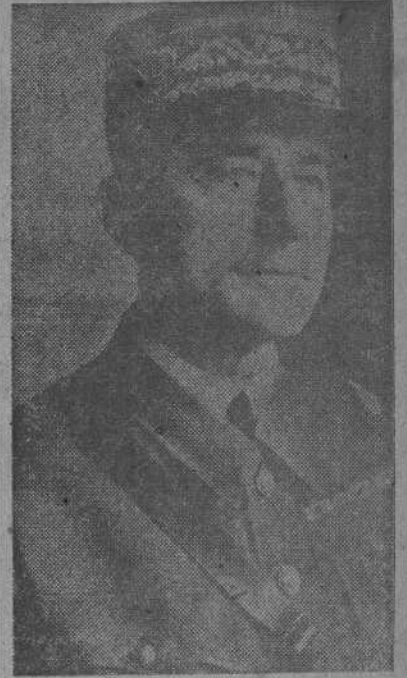
El Residente General de Francia en Marruecos, general Nogués.

Aparte del movimiento disidente de los alrededores de Argel, la población y las fuerzas francesas dan pruebas de la mayor lealtad.—(EFE)