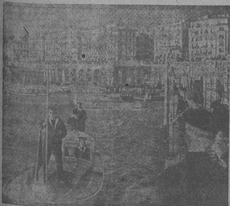
El puerto de Argel, cuya capital ha caído en poder de las tropas anglo-norteamericanas que desembarcaron en la madrugada del domingo en los territorios del Norte de África

WASHINGTON 9.—Por orden del Departamento de Estado, la Embajada francesa ha sido privada de comunicación telefónica.—(EFE).