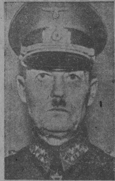
VON RUNDSTEDT que, por orden del Führer, colaborará con el mariscal Pétain para garantizar la defensa de Francia

que en ninguna circunstancia se debía disparar contra fuerzas anglo-norteamericanas que intentarían desembarcar. Entre tanto, se han descubierto otras infracciones a las obligaciones impuestas por el armisticio. En virtud de lo que antecede me permito, señor mariscal, informaros de lo que sigue: Primero.—Me doy perfectamente cuenta de que vos, señor mariscal, nada tenéis que ver con esos manejos y que han de producirnos hondo sufrimiento. Segundo.—Represento los intereses de un pueblo al que le ha sido impuesta la guerra y que, por instinto de conservación, debe luchar contra los que la produjeron, y continuar hoy día en su intento de aniquilar toda Europa. Tercero.—Me voy en la obligación de continuar esta guerra, en la que millones de hombres tratan de separarse de la explotación capitalista y luchan para conservar su espíritu nacional. ORDEN DE OCUPAR TOLON Señor mariscal, el pueblo alemán, en nombre del cual os entrego esta declaración, no siente odio con respecto al pueblo francés; pero como su jefe y su representante estoy decidido a no entregar Alemania y Europa al caos, tolerando las maniobras de los elementos causantes de esta guerra espantosa. Por lo tanto voy a actuar contra las organizaciones y, sobre todo, contra las personas que desean impedir hoy y mañana