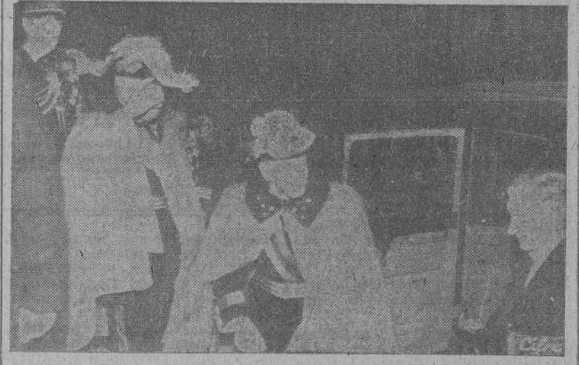
El Jefe del Estado portugués, general Carmona, a su llegada al Palacio de la Asamblea Nacional en Lisboa, para inaugurar la tercera legislatura.

Tres jóvenes franceses exploraron las fuentes del Amazonas En el fondo de la selva encontraron ruinas de una civilización desconocida