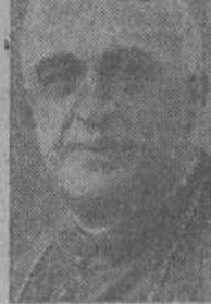
Dr. Muniz de Pablos

El oferente llegó en automóvil procedente de La Coruña y se dirigió a la Plaza de España, donde se halla emplazada la Casa Consistorial, a cuyo salón de actos pasó seguidamente. Todas las autoridades saludaron al Gobernador civil de la provincia, representante de S. E. el Generalísimo en el acto de la ofrenda.