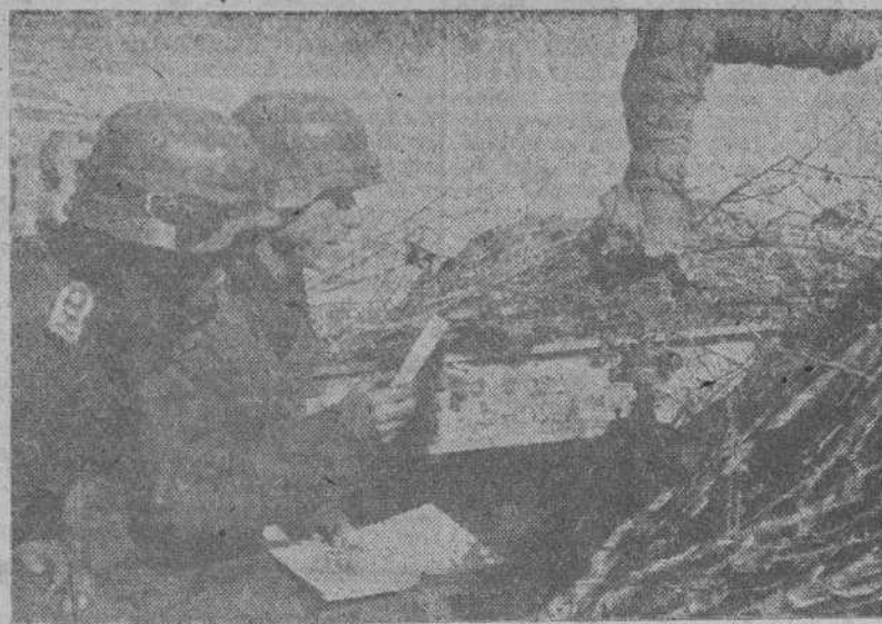
Vigilantes de una posición avanzada alemana, observan por medio del telescopio de tijera las maniobras del enemigo, en el sector comprendido entre el Don y el Volga.