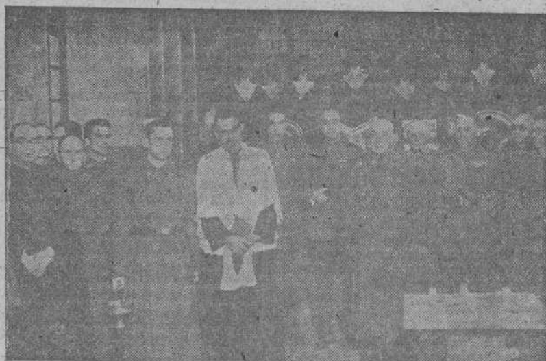
El "Hogar del Soldado", inaugurado el domingo en el Cuartel del Regimiento de Infantería de Zamora, núm. 29