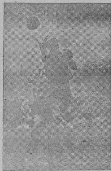
Un saque de esquina contra el Granada

ARBITRO: Sr. Rodríguez. JUECES DE LINEA: Señores Cabrera (don Daniel) y Rey Lago, Granada.—Floro; Millán, Alejandro; Nicola, Bonet, Sierra; Marín, Trompi, Leal, Conde, Mas. R. C. D.—Acuña; Víctor, Portugués; Molaza, Bienzobas, Muntané; Cuca, Yll, Valle, Cárdenas, Chao. GOLES: Deportivo, 2 (Valle, Bienzobas); Granada, 2 (Mas, Conde). SAQUES DE ANGULO: Deportivo, 3 (todos en el segundo tiempo); Granada, 1 (en el primer tiempo). (CONTINUA EN LA PAGINA SIGUIENTE)