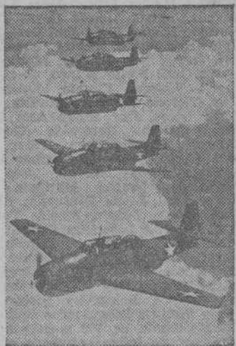
Una formación de "Avengers" de la Armada norteamericana, que colaboraron con las fuerzas navales en las batallas del Pacífico

Hoy se efectuará el traslado de los restos de Von Moltke Le serán rendidos honores de Capitán General