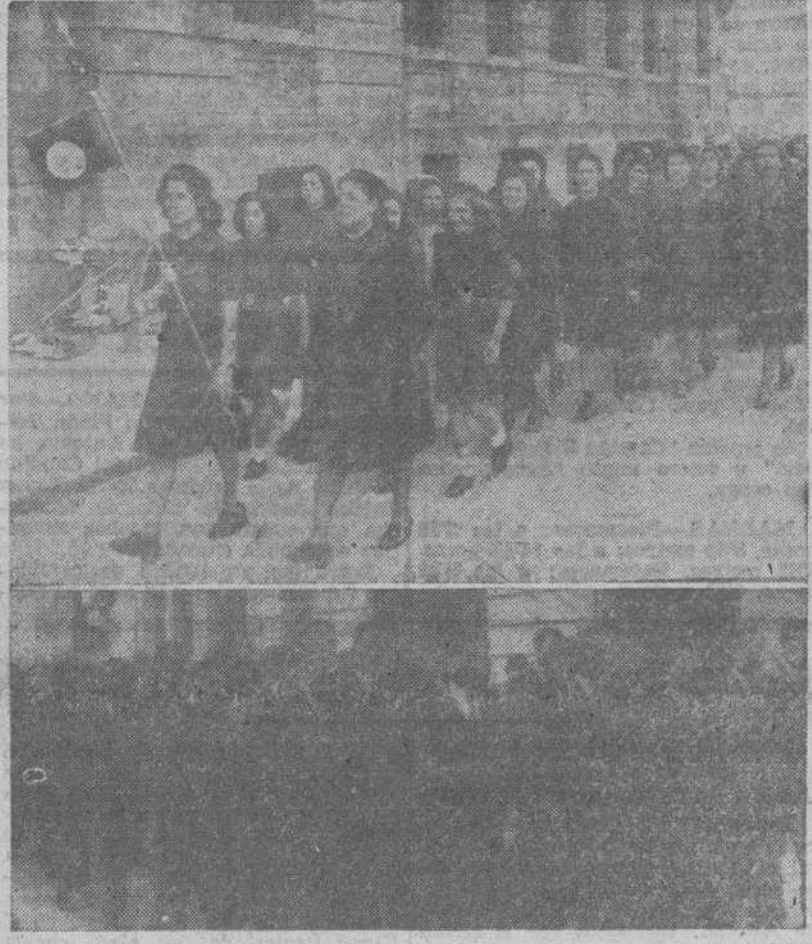
Camaradas de la Sección Femenina, del Frente de Juventudes y del SEU, que en las primeras horas de la mañana de ayer recorrieron las calles coruñesas entonando canciones patrióticas.

Frente a la tribuna del Caudillo, la (CONTINUA EN TERCERA PLANA)