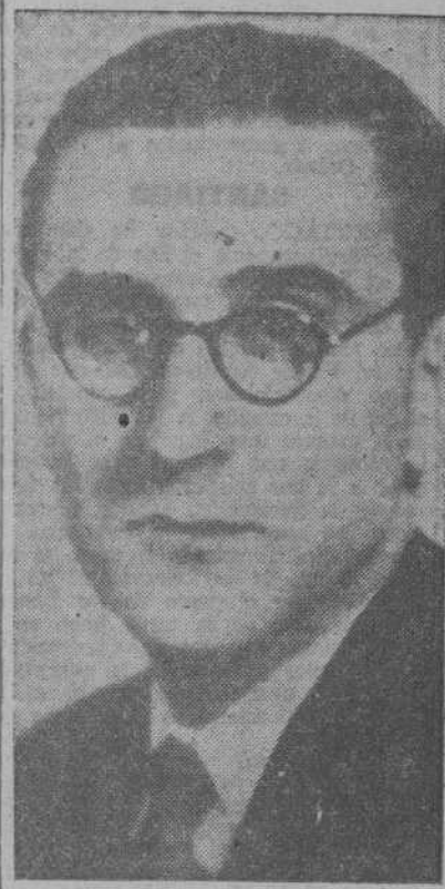
Don José María de Porciolos, nuevo Director General de Registro y Notariado.

BERLIN, 1.—Los círculos berlineses declaran con referencia al comunicado de hoy: "El total de toneladas mercantes adversarias hundidas en el mes de marzo es, como indica el comunicado militar, de 928.000; como en los Estados Unidos el tonelaje mercante se cuenta no en toneladas de registro bruto, sino en toneladas de peso muerto, el resultado es, expresado en toneladas norteamericanas, de 1.488.568. Las cifras de marzo brindan ocasión de calcular las pérdidas globales del tonelaje adversario en la guerra actual por la acción de las potencias del tripartito; el tonelaje británico y norteamericano de alta mar era en 1939 de 30'5 millones de toneladas de registro bruto, de los que correspondían 21'3 a Gran Bretaña. A ello hay que añadir el tonelaje cogido durante los primeros meses de la contienda en los más diversos países y que asciende a unos 11'5 millones de toneladas de registro bruto, con las que se tiene en 1939 un tonelaje total adversario de 42 millones de toneladas de registro bruto. El nuevo tonelaje construido por el adversario hasta marzo de 1943 es de 11'36 toneladas, de las que corresponden 8'41 millones a los Estados Unidos, arrojando así la suma de los tonelajes antiguo y nuevo, sin tener en cuenta pérdidas, 53'86 millones de toneladas de arqueo comercial, de que en teoría dispondría actualmente el adversario.