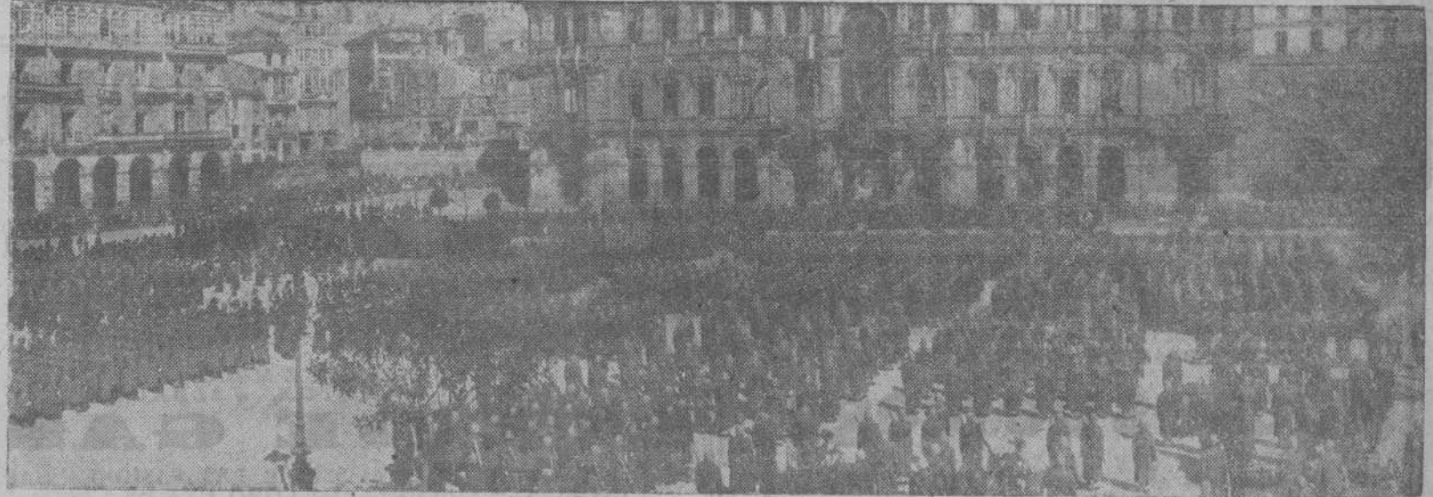
La Plaza de María Pita durante la solemne misa de campaña celebrada con motivo de la conmemoración del IV aniversario de la Victoria. El interior de la Plaza fué ocupada por las fuerzas armadas y Milicias; el público abarrotó los soportales y las calzadas.