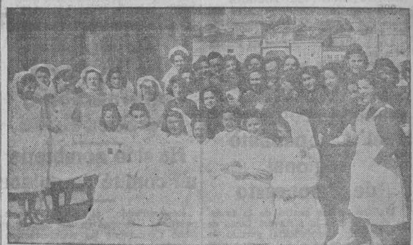
Camaradas de la Sección Femenina que concurren al cursillo de enfermeras inaugurado ayer en La Coruña

Ayer, viernes, tuvo efecto, en el Salón de Actos de la Casa de la Falange, el acto inaugural del Curso de Enfermeras de Guerra organizado por la Regiduría de Divulgación y Asistencia Sanitaria-Social de la Sección Femenina en colaboración con el Servicio de Sanidad.