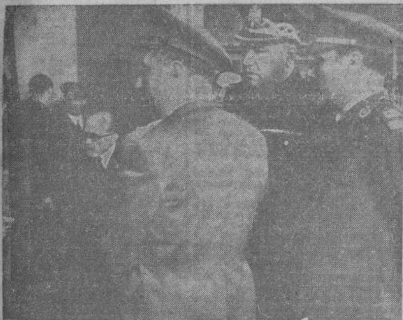
Durante su estancia en Barcelona, el ministro de Justicia, D. Eduardo Aunós, visita la Cárcel Modelo