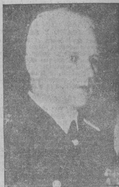
El nuevo embajador alemán en la Santa Sede, von Wizacker

BUCAREST, 28.—La nuera de Dostoievsky ha sido hallada en Sinteropol por un corresponsal de guerra rumano. Esta señora, que se llama Ecaterina, se encuentra en la miseria más absoluta. Según ella, al estallar la revolución bolchevique, estaba en San Petersburgo con la esposa e hijo del famoso poeta ruso, donde llevaban una vida holgada merced a los ingresos que les proporcionaba la venta de los libros y la pensión concedida a la viuda. Cuando empezaron los registros domiciliarios y las persecuciones, la familia Dostoievsky huyó, refugiándose la esposa del poeta en una pequeña ciudad de provincias, el hijo en Moscú y Ecaterina en el Cáucaso, en casa de sus padres. Tras la derrota de Wrangel, la señora de Dostoievsky fué expulsada de donde vivía, encontrándose sola unos amigos pidiendo por las calles de Yalta. La pobre anciana hubo de trabajar para su sustento y murió de agotamiento. Fué enterrada en una fosa común de mendigos.—(EFE).