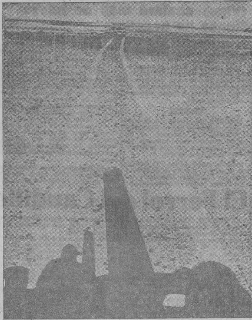
Un tanque norteamericano deja sus huellas en las arenas del desierto durante la ofensiva aliada en Africa del Norte