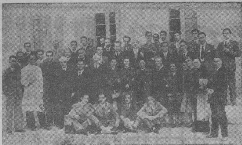
Grupo de practicantes que asisten al curso de perfeccionamiento sanitario...