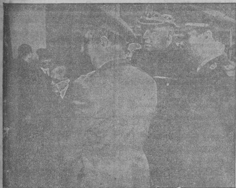
Durante su estancia en Barcelona, el ministro de Justicia, D. Eduardo Aunós, visita la Cárcel Modelo