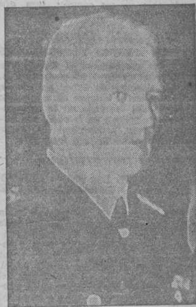
El nuevo embajador alemán en la Santa Sede, von Witzsacker