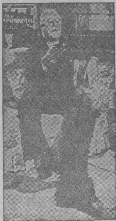
El perro más envidiado de América, recibiendo su comida de manos del Presidente Roosevelt