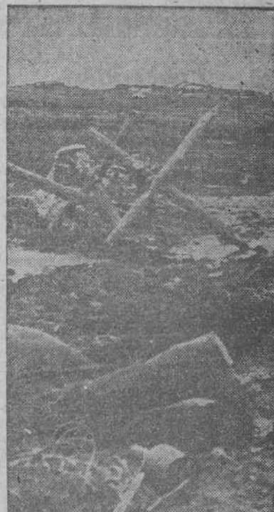
Con una granada en la mano, intentó acercarse este soldado bolchevique hasta las posiciones alemanas. Mas su misión de arrojar la granada contra los alemanes no pudo ser cumplida