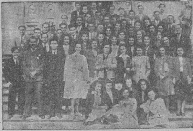
Alumnos de séptimo año del Bachillerato que finalizaron sus estudios en el Instituto de Enseñanza Media de La Coruña