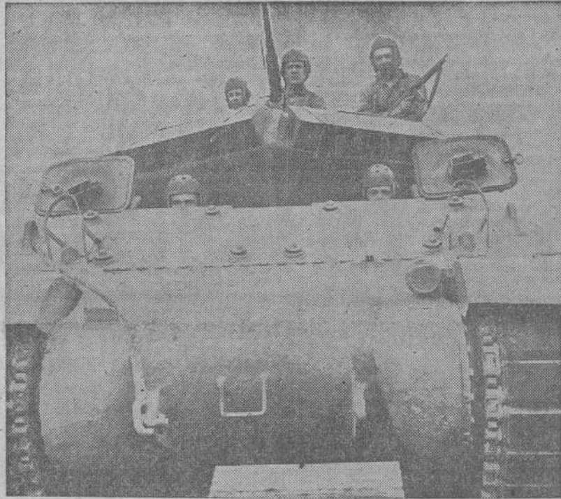
Nuevo modelo de tanque americano destinado especialmente a la destrucción de tanques enemigos y que actuó por primera vez en la fase final de la batalla de Túnez