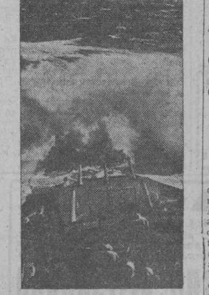
Con la proa cubierta por las olas, este crucero en servicio de patrulla, surca velozmente el Atlántico. El navío ya conoce las "caricias" de los torpedos, pues recientemente tuvo que ser reparado de graves averías.

ARGEL, 4.—El nuevo comité francés de liberación ha estado reunido durante cerca de tres horas. Todos los miembros han asistido a la reunión. No se ha dado ningún comunicado de lo tratado en ella.—(EFE).