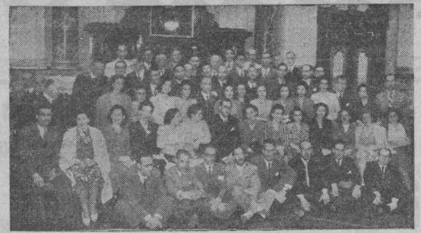
La Coral Polifónica de Pontevedra, recibida oficialmente en el Palacio municipal de La Coruña