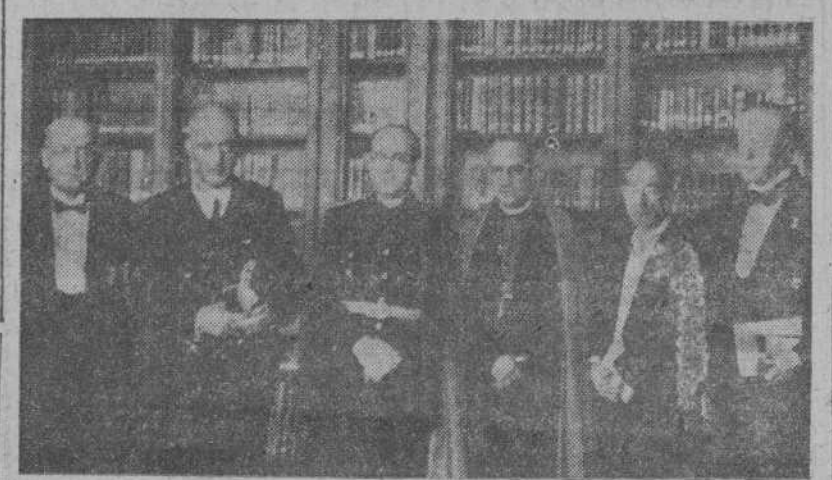
El Ministro de Educación Nacional, con el Obispo de Madrid-Alcalá y otras personalidades concurrentes a la solemne sesión celebrada por la Real Academia Española en memoria de don Francisco Rodríguez Marín.