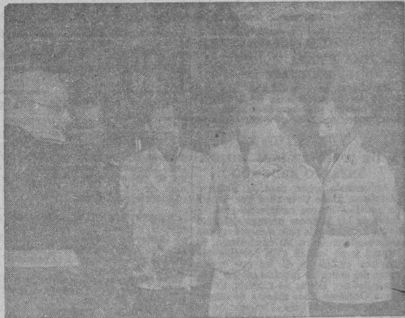
Una comisión malagueña, acompañada por el ministro secretario general del Partido, camarada Arrese, hizo entrega a S. E. el Jefe del Estado, Generalísimo Franco, en el Palacio de El Pardo, de la Medalla de Hermano Mayor de la Cofradía de la Esperanza, de Málaga.