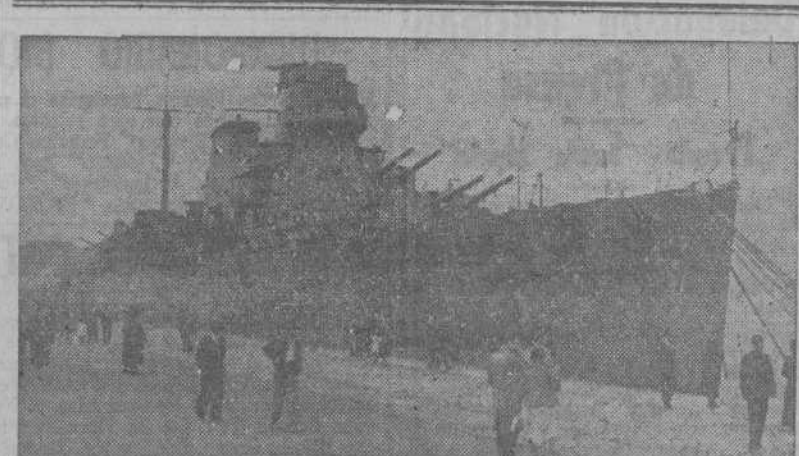
El crucero "Canarias" atracado al muelle de Méndez Núñez.

BARCELONA 20.—El capitán general de la cuarta región, teniente general Moscardó, ha expresado su satisfacción y a la vez su felicitación, al personal de la Jefatura Superior de Policía por el éxito obtenido al detener totalmente a la banda de atracadores que actuaba desde hace algún tiempo. Como autoridad militar encargada de sancionar esta clase de delitos—dice el general Moscardó—mi satisfacción obedece no sólo a la detención efectuada de estos maleantes y a la rapidez y agudeza con que ha funcionado la Policía, sino también a la colaboración prestada por cuantas personas han podido aportar algún dato para esclarecer los hechos. No solamente no han rehusado prestar declaración, sino que han contribuido espontáneamente. Es deber de todos contribuir al esclarecimiento de estos delitos que tanto turban la paz a que tiene derecho la población honrada y trabajadora de Barcelona. El capitán general terminó diciendo que el proceso con carácter sumarisimo está a punto de verse en Consejo de guerra.—(CIFRA).