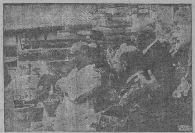
S. E. el Jefe del Estado Generalísimo Franco visita en Fuenterrabía el albergue escolar “Blanca de Navarra”, que sostiene la Diputación de Navarra.

¡Arriba España! ¡Viva España! — (CIFRA).