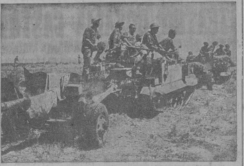
Los carros Bren, británicos, con cañones antitanques a remolque, avanzando por territorio italiano

Nuestros bombarderos continuaron anoche sus ataques contra el nudo de carreteras de Formia. En el curso de estas operaciones y de misiones de patrulla, han sido destruidos 18 aviones adversarios. Diez de nuestros aparatos no han regresado. Se confirma ahora que en el ataque del 7 de septiembre, contra Foggia, (CONTINUA EN TERCERA PLANA)