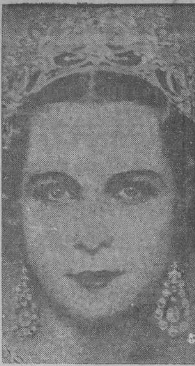
La princesa de Piemonte, esposa del heredero de Italia, que se ha refugiado en Suiza con sus cuatro hijos

Dispongo: Primero.—Las tropas de la guarnición de Roma y las fuerzas de Policía a mi disposición para la protección de la ciudad abierta de Roma, establecerán puestos de vigilancia a lo largo de la demarcación de la ciudad abierta de Roma. Segundo.—Todos los militares, cualquiera que sea su grado, que se encuentran en Roma, pertenecientes a los de-