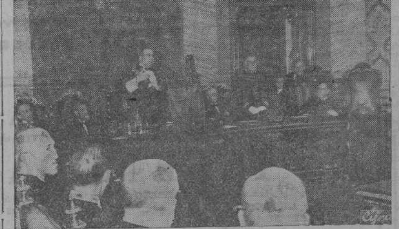
MADRID.—El Ministro de Justicia, durante su discurso en el acto de la solemne apertura de los Tribunals.