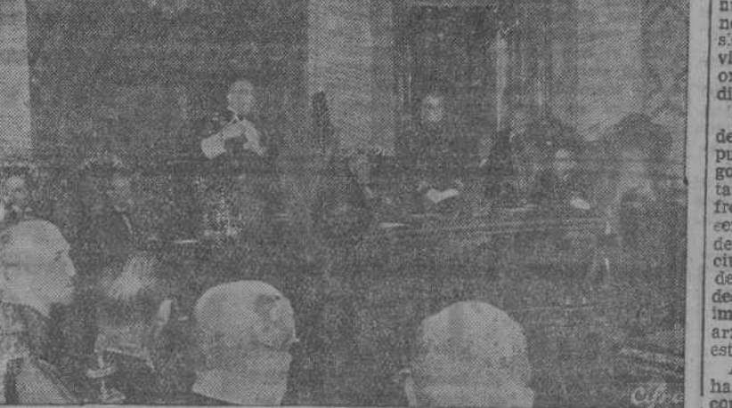
MADRID.—El Ministro de Justicia, durante su discurso en el acto de la solemne apertura de los Tribunals.