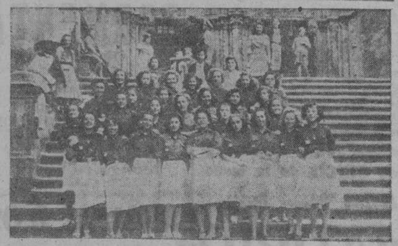
Santiago.—Camaradas del Albergue Universitario femenino del SEU, de Foxón, que han ganado el jubileo.