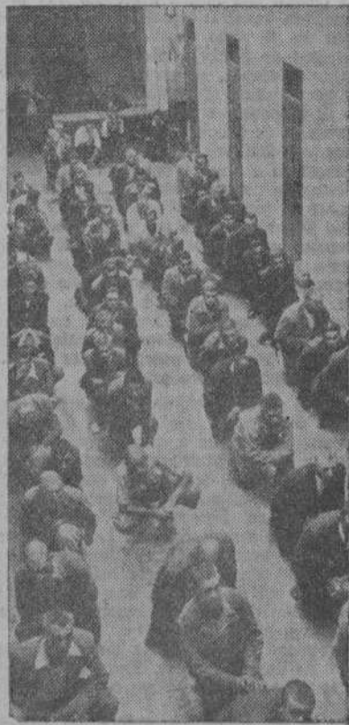
Aspecto de una de las galerías de la Prisión durante la misa

En honor de los niños, hubo una fiesta infantil. Se recitaron cuentos;