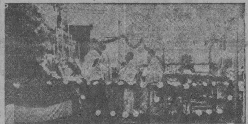
Un momento de la misa solemne celebrada ayer en la Prisión provincial con motivo de la festividad de Nuestra Señora de las Mercedes (Información en la plana tercera)