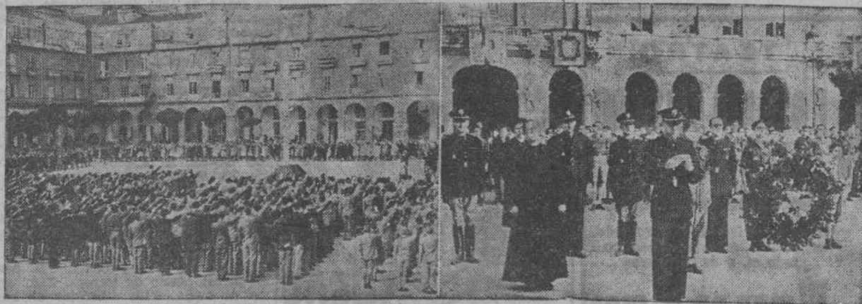
Notas gráficas de la jornada de ayer: Autoridades y jerarquías portando las coronas de laurel que han sido colocadas bajo la cruz y placa que figuran en la fachada principal de la iglesia de San Jorge.—El jefe provincial del Movimiento leyendo la Oración de los Caídos.—El público, brazo en alto, entonando el Cara al Sol con que finalizó la solemne ceremonia.—Abajo: Dos aspectos de la Plaza de María Pita durante los actos celebrados por el Frente de Juventudes para conmemorar el Día de la E. (Fotos EL IDEAL GALLEGO).

Las misas del Día de Difuntos serán aplicadas por los muertos de la guerra Por disposición del Papa