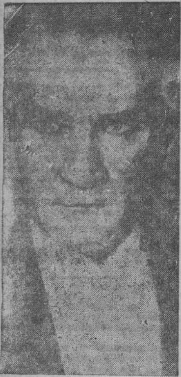
Kemal Atatürk, fundador del nuevo Estado turco

LONDRES, 29.—Con motivo del veinte aniversario de la fundación de la República turca—ha dicho el radio Angora—el Presidente Inonu ha declarado: