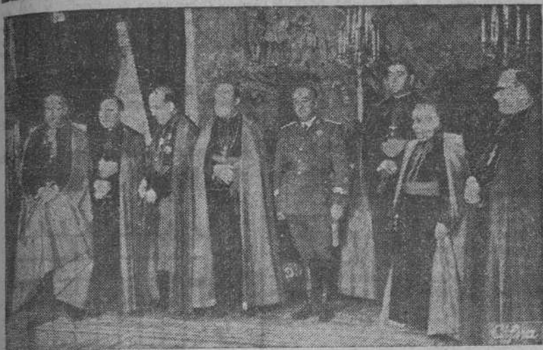
En el Palacio de El Pardo y ante el Caudillo se celebró la jura de los Obispos de Vitoria, Palencia, León, Astorga, Almería, Cuenca y Guadix.

Los actos de La Coruña revistieron gran esplendor