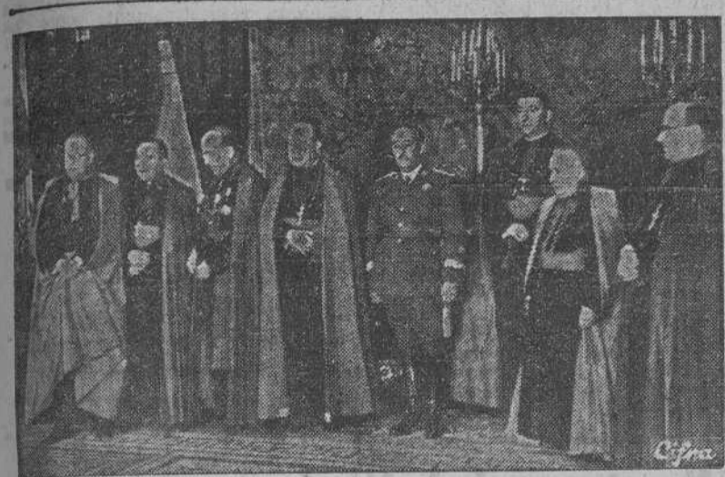
En el Palacio de El Pardo y ante el Caudillo se celebró la jura de los Obispos de Vitoria, Palencia, León, Astorga, Almería, Cuenca y Guadix.