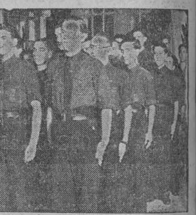
Cadetes del Frente de Juventudes que pasaron a militantes del Movimiento

Todos los actos estuvieron presididos por las jerarquías del Frente de Juventudes.