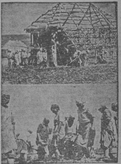
Construcción relámpago de una casa en Ucrania.—Mujeres ucranianas construyen en un abrir y cerrar de ojos una rudimentaria casa de madera.