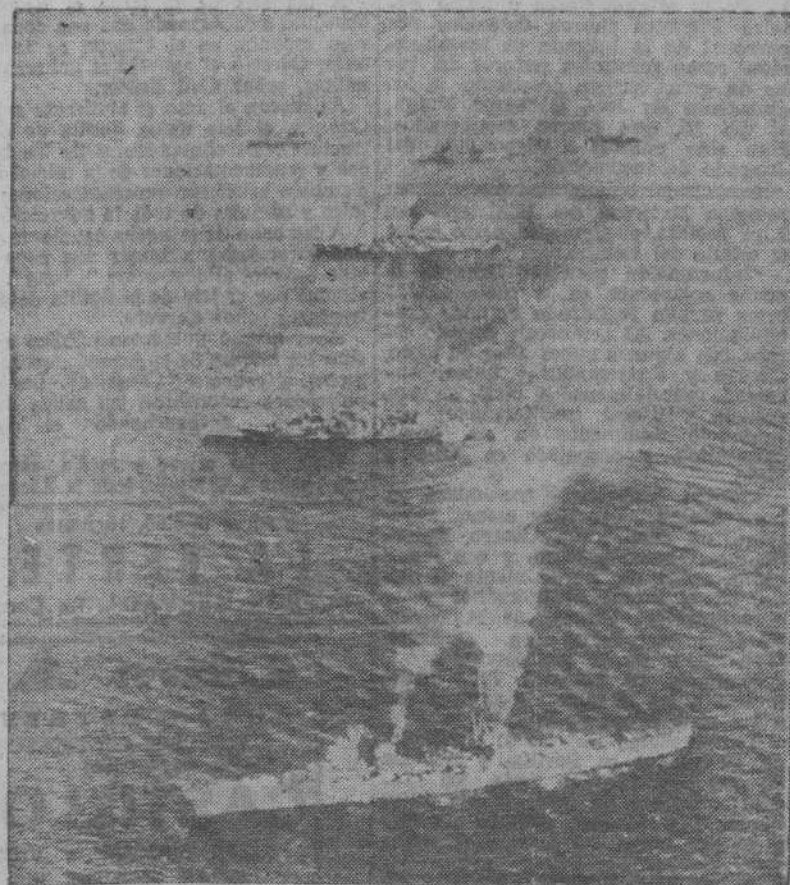
Los acorazados y cruceros italianos, acompañados por las naves insignias de escolta, llegan al gran puerto de La Valetta, en la isla de Malta, donde se entregó el grueso de la flota italiana a los aliados. La foto, que no es de gran actualidad, tiene, en cambio, inapreciable valor histórico.