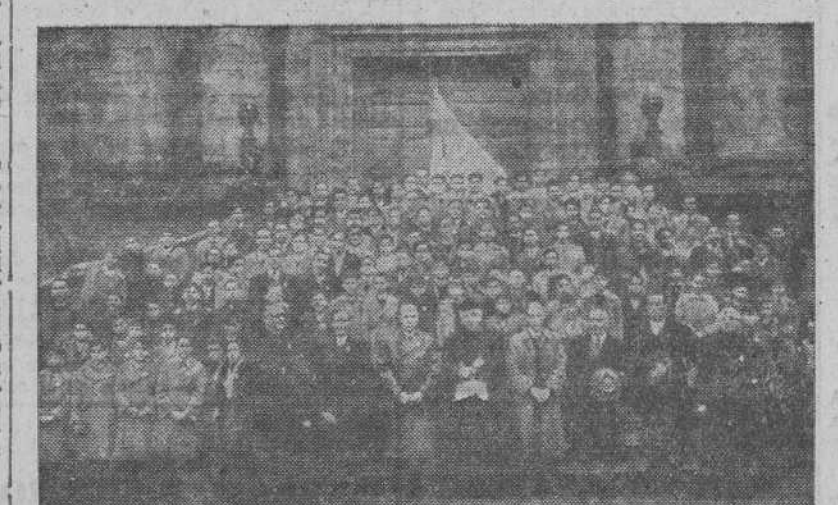
SANTIAGO.— La Peregrinación del Instituto Masculino de La Coruña, después de haber ganado el Jubileo del Año Santo.