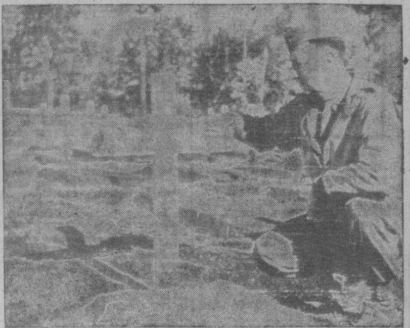
El general Mark Clark ante una de las tumbas de los combatientes caídos del Quinto Ejército, en un Cementerio de Italia. (Foto recibida por radio).