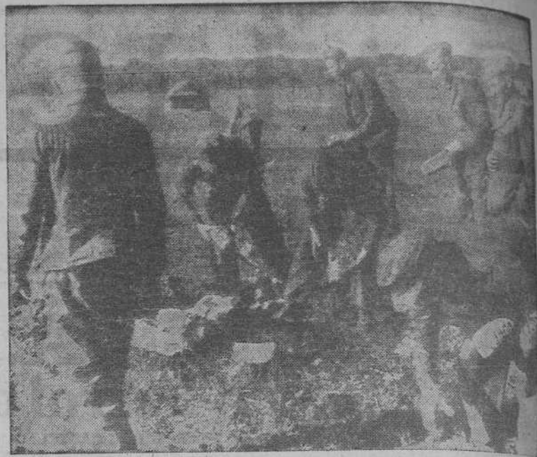
Suministros para los valientes combatientes alemanes de las bandas de franco-tiradores. Desde el aire les es enviada toda clase de víveres.